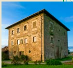
Leagi dorrea Torre de Leagi