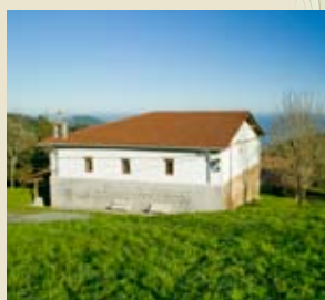
San Lorenzo basiliza Ermite de San Lorenzo