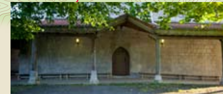
Antiguako Andra Maria eliza Iglesia de Ntra. Sra. de la Antigua

Iraupena gitxi gorabehera 7 h. 15' Horario aproximado