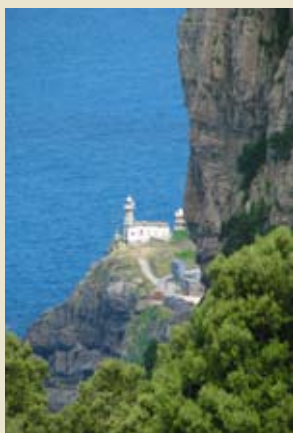
Sta. Katalina faroa Faro de Sta. Catalina