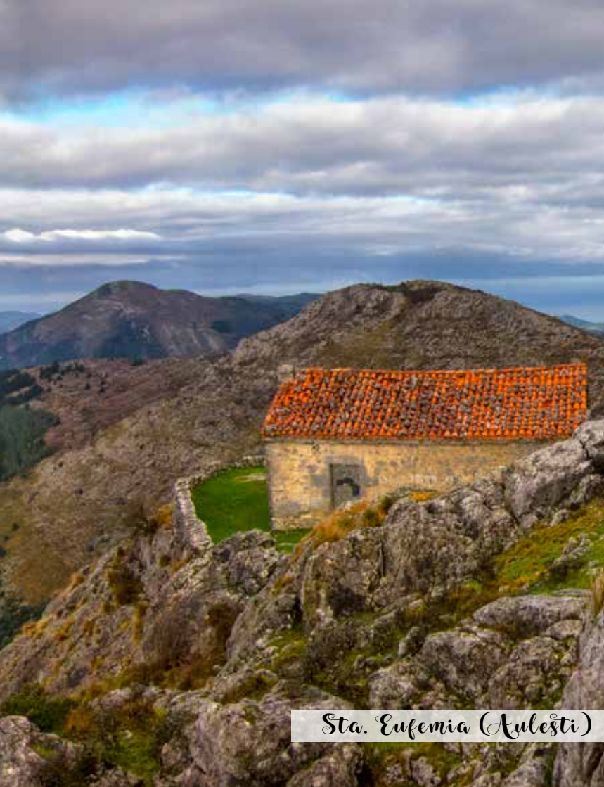
Sta. Eufemia (Aulesti)