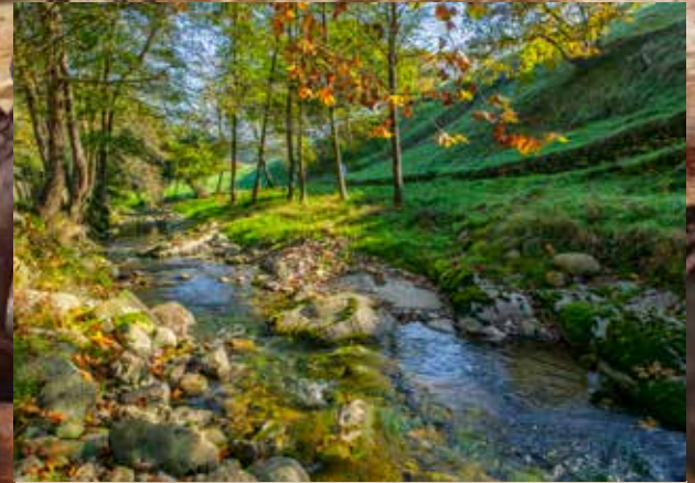
Rivière Markola (Ziortza-Bolibar)