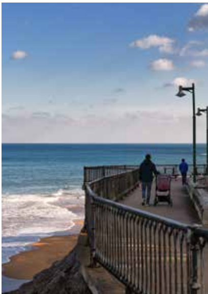
Promenade de Karraspio.