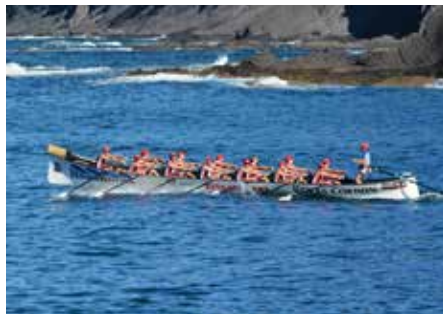
Ondarroako "Antiguako Ama".