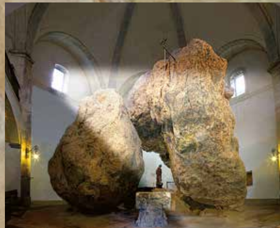
Ermitage de San Miguel de Arretxinaga, Markina-Xemein.

Tout au long des siècles les pèlerins qui se dirigeaient à Saint Jacques ont toujours trouvé un refuge dans notre région. Aujourd'hui le chemin de Saint Jacques qui parcourt la côte de la mer Cantabrique entre en Biscaye par Lea Artibai. Les visiteurs croiseront le spectaculaire ermitage de San Miguel de Arretxinaga , à Markina-Xemein. Avant de partir vers Guernica, le parcours fait une pause à Ziortza-Bolibar. Là se trouve la seule collégiale de Biscaye , nommée monument national du Pays Basque. Mais si cette commune est connue pour quelque chose c'est en raison de Simon Bolivar, car elle est considérée être le village natal des ancêtres du « libérateur » américain.