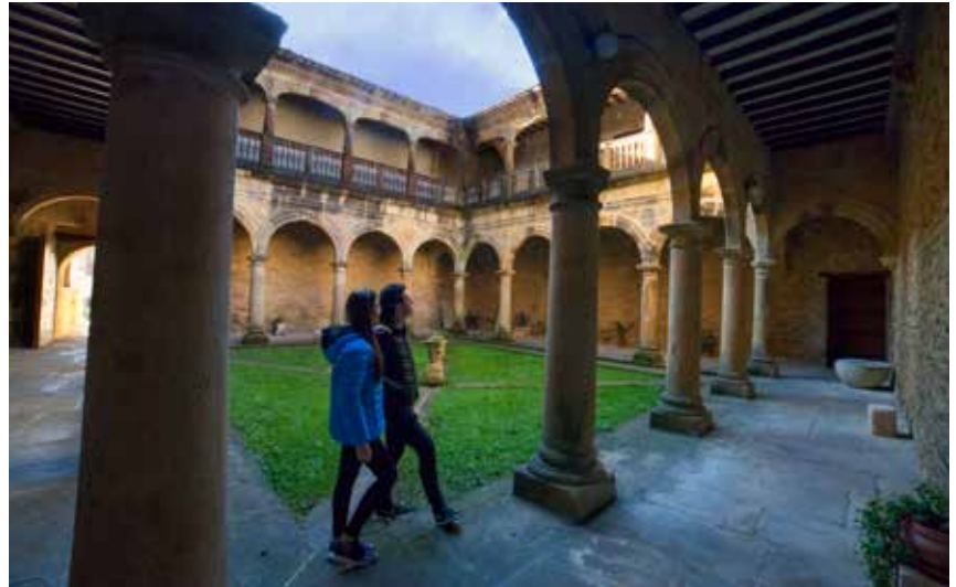
Cloître de la collégiale de Ziortza