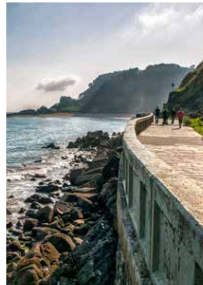
La promenade qui va d'Ondarroa à Saturraran.

Les habitants de la côte ont l'ennui de la mer dès qu'ils s'en éloignent. Ce n'est pas surprenant. Quelle personne ne s'est pas détendue avec la musique des vagues qui viennent se briser contre les rochers ? Qui n'a pas senti la caresse de la douce brise marine sur son visage ? Celui qui s'approchera de la côte de Lea Artibai éprouvera ce plaisir : partez du port d'Ondarroa en direction de la plage de Saturraran qui borde un des plus beaux coins du littoral : laissez-vous attirer par le signal lumineux du phare de Santa Katalina que l'on aperçoit depuis la route qui serpente le long des falaises ; prenez un repos relaxant sur la vaste plage de Karraspio après avoir parcouru la promenade qui s'étend au cœur de Lekeitio . Les vingt kilomètres de côte offrent un itinéraire à nul autre pareil et une opportunité pour découvrir ses coins les plus beaux en faisant du bien à votre santé. Marchez, reposez-vous, contemplez, profitez et reprenez le chemin.